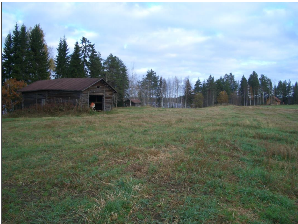
Karelinniemen länsiosaa kuvattuna pohjoiseen. Kvartsit havaittiin ladon ympäristössä. Mahdollisesti paikalla on kivikautinen asuinpaikka